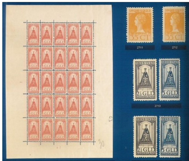
Voor de belegger: NVPH nrs 129-131 pfr, nr 127A pfr (NP Veiling okt 2011)

Sommige mensen investeren in eigen werk. Voor een dun prijsje een 'partij' postzegels kopen, en daarvan een of meer fraai opgezette verzamelingen maken. De computer biedt een helpende hand. Dat zou al binnen een jaar winstgevend kunnen zijn, of niet natuurlijk.